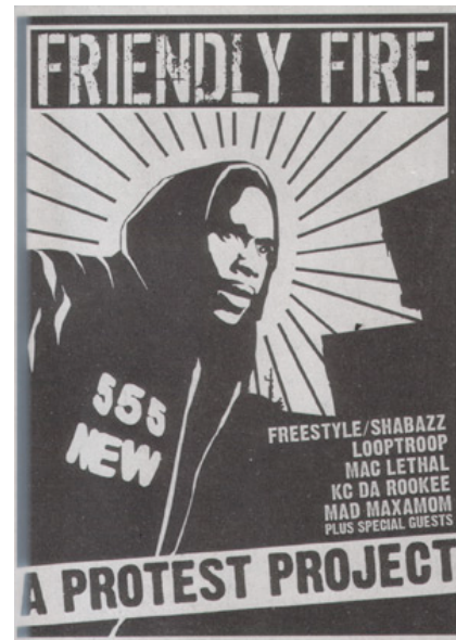
Abbildung 4: „Friendly Fire“-Flyer, 2003

So weist der Flyer von 1999 (Abb. 1) keine stilistischen Elemente auf, die von der Szene als ihre eigenen erkannt und anerkannt werden; unsere Fokusgruppe kommentierte ihn mit Formulierungen wie „beliebig“, „sieht nicht nach hiphop aus“, „hätte auch ne technoparty sein können“, „sieht aus wie ein neues waschmittel oder so was“. Einer der Gesprächspartner charakterisierte das alte und das neue Logo (Abb. 2) im Vergleich folgendermaßen: