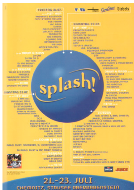
Abbildung 1. splash! Flyer 1999